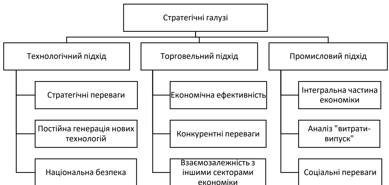
Рис. 1. Підходи до визначення стратегічних галузей національного господарства

Запропоновано модель впливу стратегічних галузей на економіку, яка встановлює як прямий, так і опосередкований вплив галузі на національне господарство. При вимірюванні прямого економічного впливу певного сектору рекомендуємо використовувати будь-який показник, що найбільш точно визначає розмір галузі, наприклад, частку у ВВП або питому вагу зайнятих у галузі в загальній кількості зайнятих, а для оцінки опосередкованого впливу галузі на національне господарство пропонуємо встановити залежності, що існують між певною галуззю та іншими секторами економіки, а також напрям цієї залежності, тобто потрібно визначити: чи галузь отримує імпульси від інших секторів, чи саме вона створює ці імпульси для інших секторів. Обґрунтовано основні напрями впливу державного регулювання на функціонування економіки і отримано висновок, що спрощення процедур державного регулювання є позитивним явищем для економіки, особливо за умови скорочення витрат на його реалізацію. Визначено, що підставою для запровадження державного регулювання повинен бути ретельний аналіз, який дасть змогу сформулювати комплекс заходів, що торкаються одночасно таких сфер як торгівля, інвестиції, конкуренція та технології (рис. 1).