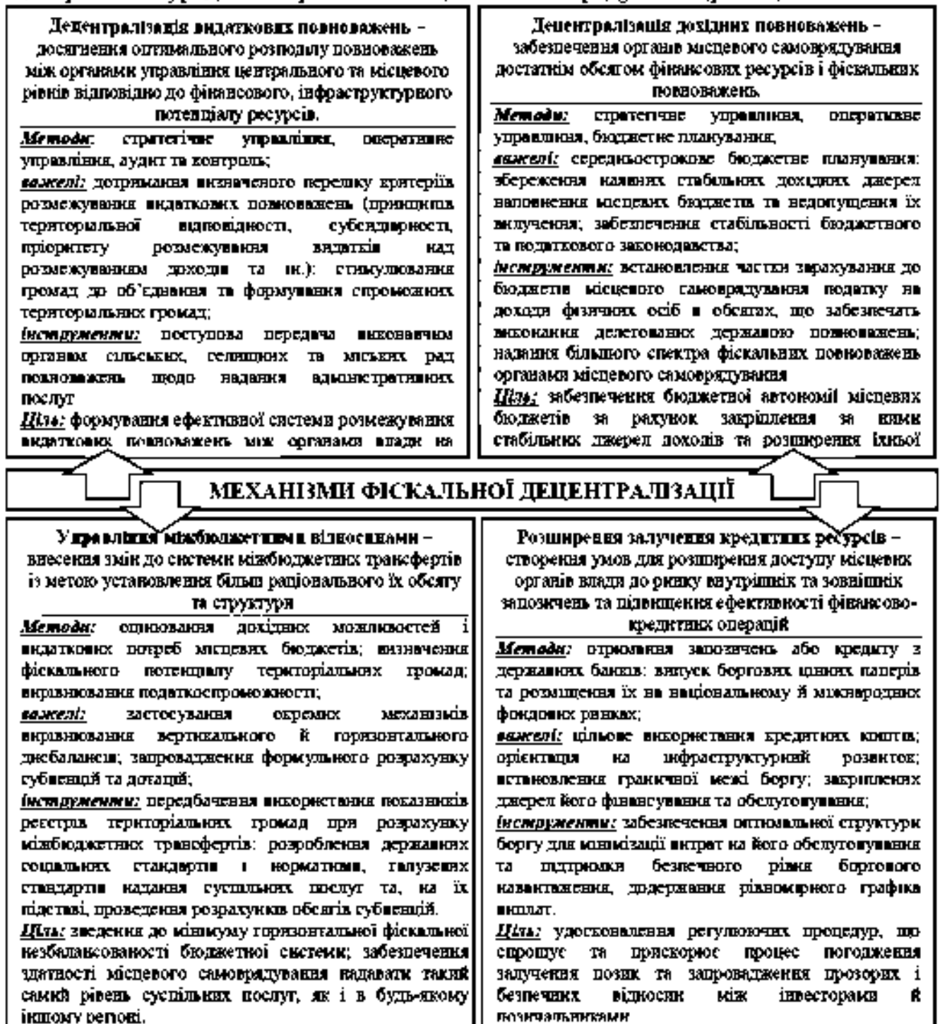
Рис. 1. Механізми реалізації фіскальної децентралізації

Розкрито зміст поняття «механізми реалізації фіскальної децентралізації» та представлено основні їх складові. Визначено сукупність необхідних умов та факторів, що впливають на упровадження фіскальної децентралізації. Механізми реалізації фіскальної децентралізації – система методів, важелів та інструментів, що застосовуються з метою здійснення, поглиблення фіскальної децентралізації та формування раціональніших пропорцій розподілу доходів, видаткових і фіскальних повноважень між центральним урядом та органами місцевого самоврядування (рис. 1).